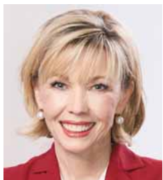
Doris Schröder-Köpf Niedersächsische Landesbeauftragte für Migration und Teilhabe, MdL