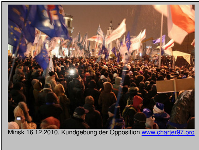
Minsk 16.12.2010, Kundgebung der Opposition