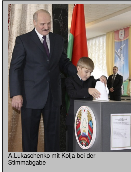
A.Lukaschenko mit Kolja bei der Stimmabgabe

Applaus und ein Erinnerungsgeschenk. Insgesamt verläuft die Wahl hier ruhig. Zu diesem Zeitpunkt hatten bereits rund 60% der Wähler ihre Stimme abgegeben. Als erste kamen traditionell Rentner ins Wahllokal, am späteren Vormittag Menschen mittleren Alters und junge Leute.