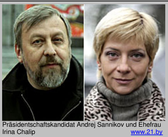
Präsidentschaftskandidat Andrej Sannikov und Ehefrau Irina Chalip

ekelhafte faschistische Macht zu stürzen. (...) Ich bin überzeugt, dass am 19. Dezember der Platz voll sein wird.“ Sie äußerte sich auch scharf über Lukaschenko und den Chef von dessen Administration, die versuchen würden, das Volk einzuschüchtern. „Das wird ihnen nicht gelingen, weil unsere Werte die Liebe zum Land und die Achtung des Menschen sind. Ihr einziger Wert sind die Sessel, auf denen sie mit ihren Popos sitzen“, erklärte Chalip. Die Versammelten begrüßten begeistert diese Worte. Chalip zeigte auf die Rathausuhr: „Diese Uhr zählt die letzten Tage und Stunden der Diktatur.“ Danach sprach Andrej Sannikov und erinnerte daran, dass heute der internationale Tag der Solidarität mit den Verschwundenen