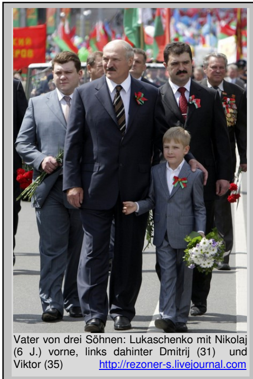
Vater von drei Söhnen: Lukaschenko mit Nikolaj (6 J.) vorne, links dahinter Dmitrij (31) und Viktor (35) http://rezoner-s.livejournal.com

Rückkehr zu einer Staatssymbolik (Flagge und Wappen), die sich kaum von der der Bjelorussischen Sowjetrepublik unterschied und die die nach Erklärung der Unabhängigkeit 1991 eingeführte weiß-rot-weiße Flagge und das Wappen mit der Abbildung eines Ritters hoch zu Ross („Pogonja“) ablöste. Mit einem Referendum im November 1996 setzte er eine Verfassungsänderung durch, die ihm nicht nur eine Verlängerung seiner Amtszeit um fünf Jahre ermöglichte, so dass die nächste Präsidentschaftswahl erst 2001 stattfand, sondern auch eine bedeutende Stärkung seiner Machtbefugnisse bedeutete. Dieses Referendum wie auch die 2001 erfolgte Wiederwahl, bei der Lukaschenko im ersten Wahlgang bereits 75,6% der abgegebenen Stimmen auf sich vereinigte, stießen auf breite Kritik im Westen. Die OSZE stellte fest, dass die Wahl nicht den internationalen Standards entsprochen habe.