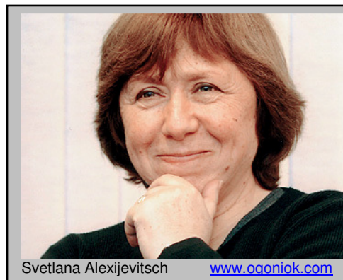
Svetlana Alexijevitsch

Schriftstellerin Svetlana Alexijevitsch geführt hat. Sie finden diese in den grau unterlegten Kästen im Text. Den vollen Wortlaut finden Sie im Internet auf: http://www.nzz.ch/nachrichten/kultur/aktuell/das_system_Lukaschenko_1.9283231.html . Sie war am 19.12. selbst auf die Straße gegangen und äußert sich zu den Wahlen und den Ereignissen am 19.12.2010 in ihrem Heimatland. Svetlana Alexijevitsch ist durch ihre Bücher auch bei uns sehr bekannt geworden, vor allem durch ihr Buch über die Tschernobylkatastrophe (Svetlana Alexijevitsch: Tschernobyl, eine Chronik der Zukunft, Berlin 1997, ISBN:3-8333-