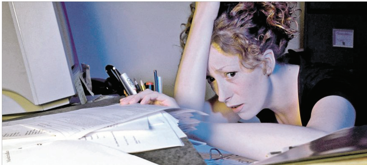
Motiviert und fleißig – und trotzdem wird die Dauerbelastung im Beruf für immer mehr junge Menschen schon nach wenigen Jahren unerträglich.