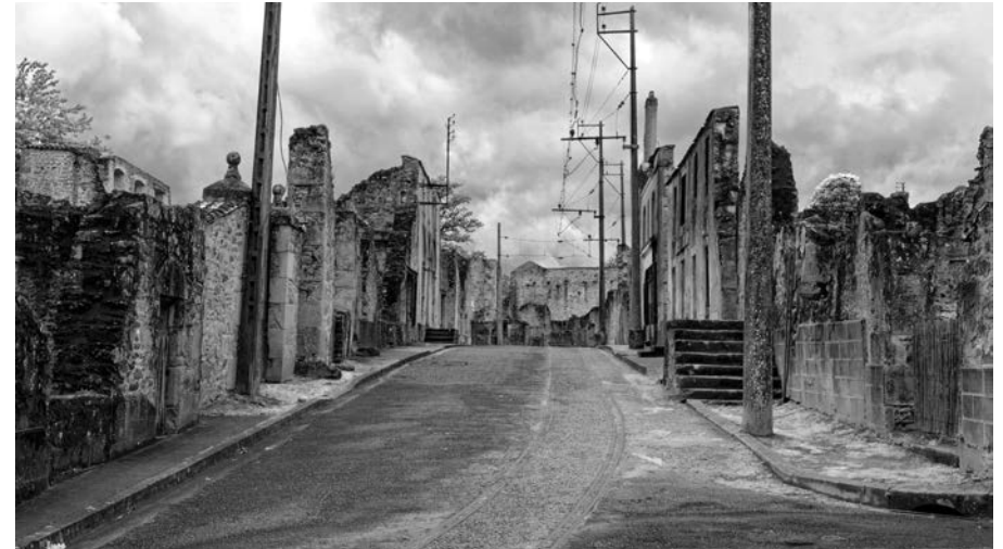
Das »alte Oradour« blieb seit dem Massaker 1944 zum Gedenken weitgehend unverändert. Für die Überlebenden wurde ein neuer Ortsteil aufgebaut.

Der französische Staat begnadigte jene wenigen verurteilten Täter nach den Prozessen von Bordeaux im Jahr 1953. Weil die allermeisten deutschen Hauptverantwortlichen in Deutschland sicher vor der Auslieferung und einem Prozess waren, konnten zunächst nur die elsässischen Soldaten verurteilt werden, die unter der deutschen NS-Besatzung zwangsverpflichtet worden waren, auf der deutschen Seite zu kämpfen. Die Verurteilung führte zu großen Protesten im Elsass und der späteren Amnestie. Seitdem erkennen die Opferfamilien die staatliche Gedenkstätte nicht mehr an und errichteten ihren eigenen Ort des Gedenkens. Das zeigt, wie ambivalent bis heute das Erinnern an diesem Ort und in Frankreich geblieben ist.