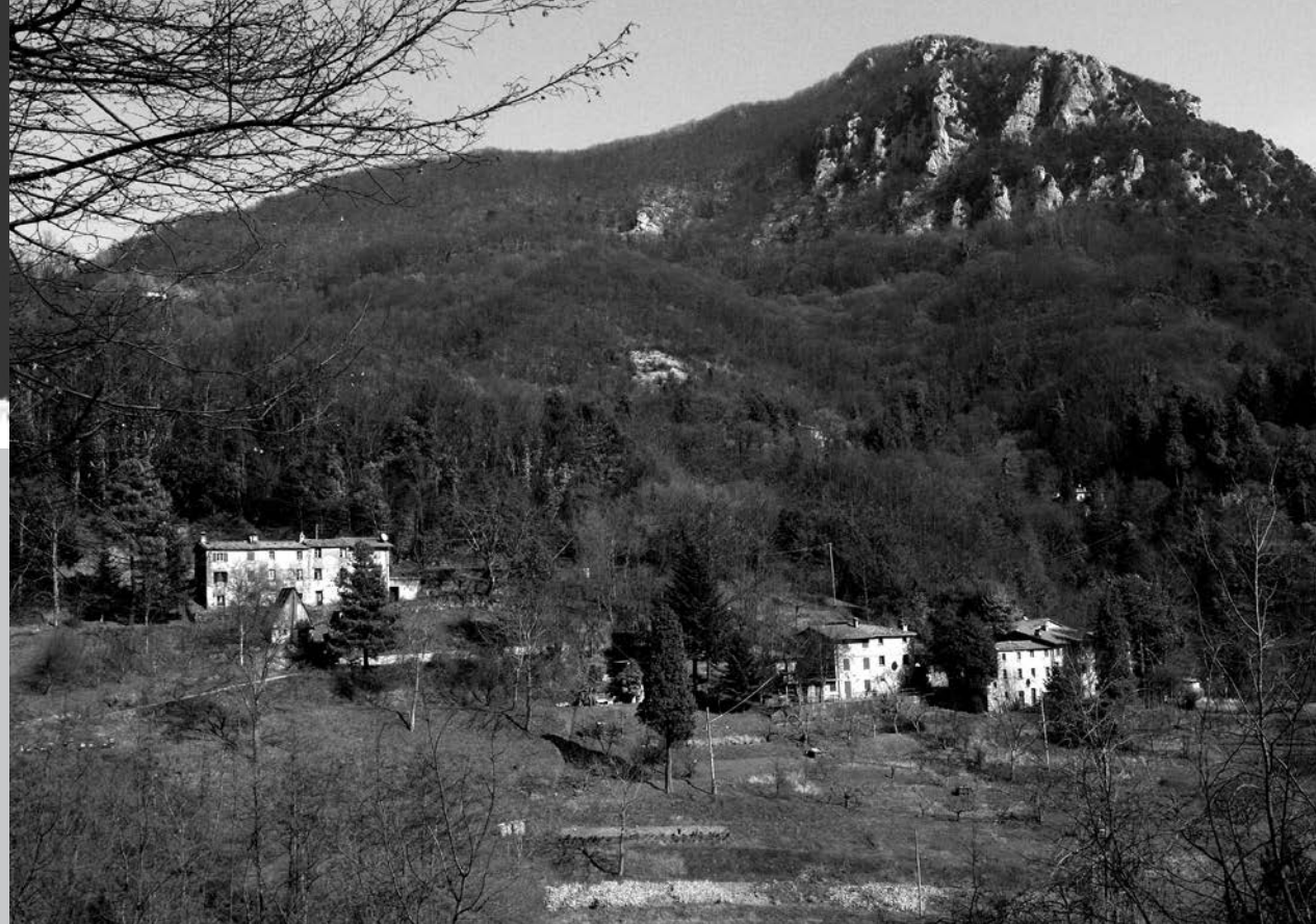
Die über die Hügel verstreuten Weiler von Sant'Anna di Stazzema heute. Die zerstörten Ortsteile wurden nur zum Teil wiederaufgebaut.

Im Dorf Sant'Anna di Stazzema in der Toskana ermordeten SS-Truppen im Sommer 1944 bis zu 560 Menschen, darunter circa 130 Kinder. In der Umgebung waren Partisanengruppen aktiv und die deutschen Besatzer ordneten vor ihrem Rückzug vor den Alliierten die Räumung des Dorfes an, was die Dorfgemeinschaft verweigerte. Die SS erschoss wahllos Zivilist*innen, verbrannte die Leichen und plünderte die Häuser. Der Ort wurde nur teilweise wiederaufgebaut. Die Täter wurden lange Zeit mit Rücksicht auf den deutschen NATO-Beitritt nicht verfolgt. Später lieferte Deutschland verurteilte Täter nicht aus. Im Ort gibt es mehrere Gedenk- und Begegnungsinitiativen.