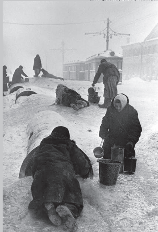
Lebensmittelkarte für 25-Gramm-Rationen Brot.

Aus einer geborstenen Wasserleitung wird Trinkwasser geborgen.