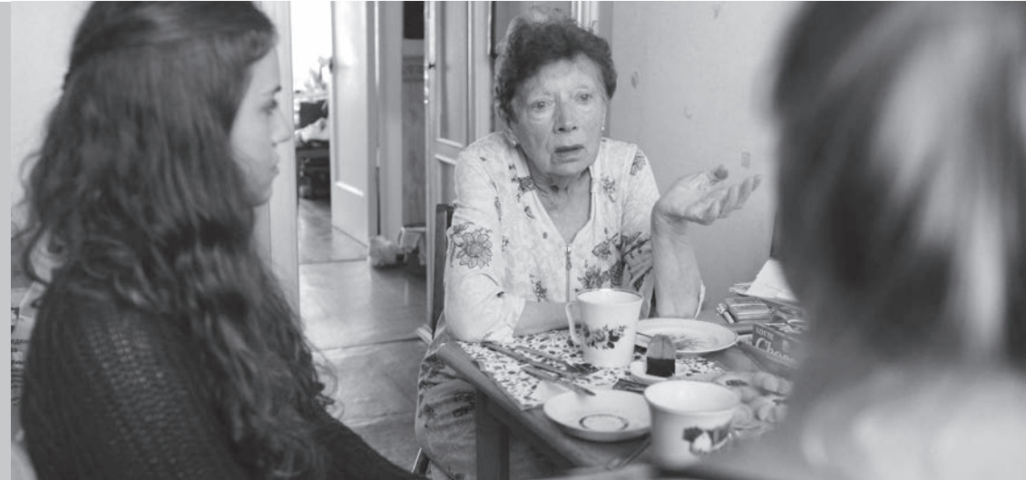
Teilnehmerinnen eines ASF-Sommerlagers im Gespräch mit einer Überlebenden der Blockade. Sie unterstützten 2018 die Zeitzeug*innen mit Putz- und Renovierungsarbeiten in ihren Wohnungen.

Aus einer geborstenen Wasserleitung wird Trinkwasser geborgen.