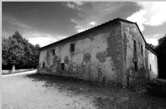
Die Casa Giubileo am Montemaggio diente den Partisanen als Zufluchtsort. Heute ist sie eine Begegnungsstätte.

19 junge Partisanen wurden durch faschistische italienische Truppen in der Gegend von Porcareccia an den Hängen des Montemaggio in der Provinz Siena erschossen. Sie waren untergetaucht, um sich der Wehrpflicht zu entziehen, und hatten sich Partisanengruppen angeschlossen. In einem Bauernhaus hielten sie sich mit mehreren Soldaten versteckt, die sie als Geiseln gegen inhaftierte Widerstandskämpfer*innen austauschen wollten. Sie wurden eingekreist und anschließend hingerichtet. Nur ein Überlebender konnte fliehen. Das Bauernhaus beherbergt heute eine Begegnungsstätte, die Casa Giubileo .