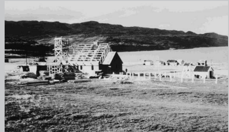
Ab Ende der 1950er-Jahre arbeiteten die ersten ASF-Freiwilligen vor allem beim Wiederaufbau in Regionen mit, die im Zweiten Weltkrieg durch die NS-Besatzung stark zerstört worden waren, wie hier beim Neubau einer Kirche in Kokelv, Nordnorwegen.

Die Finnmark im Nordosten Norwegens erlitt zu Kriegsende schwerste Zerstörungen. Bei ihrem Rückzug hinterließen die deutschen Truppen 1944 »verbrannte Erde« und zerstörten zahlreiche Wohngebäude, Schulen und Kirchen.