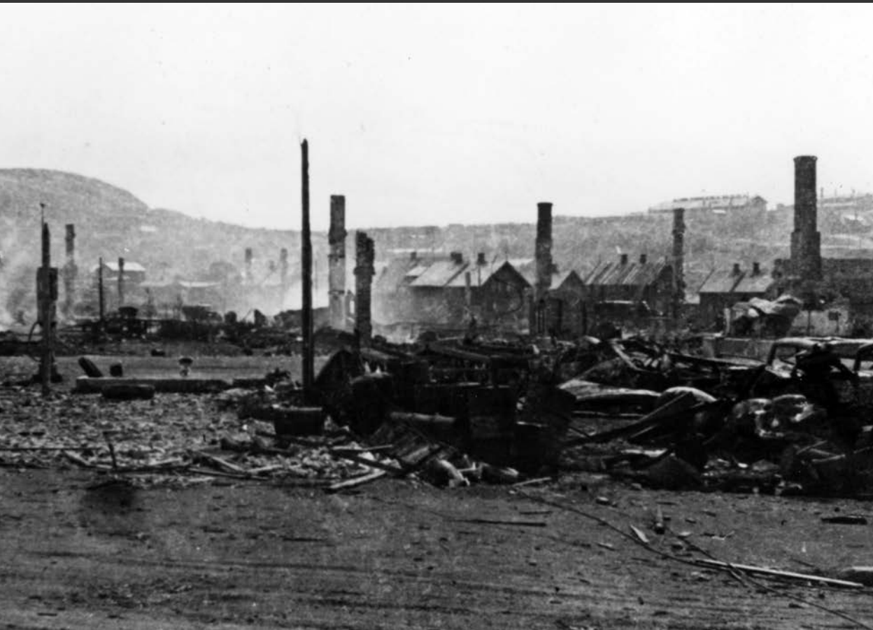
Der kleine Ort Kirkenes ganz im Nordosten von Norwegen wurde bei den Kämpfen 1944 und dem Rückzug der deutschen Besatzungstruppen weitgehend zerstört.