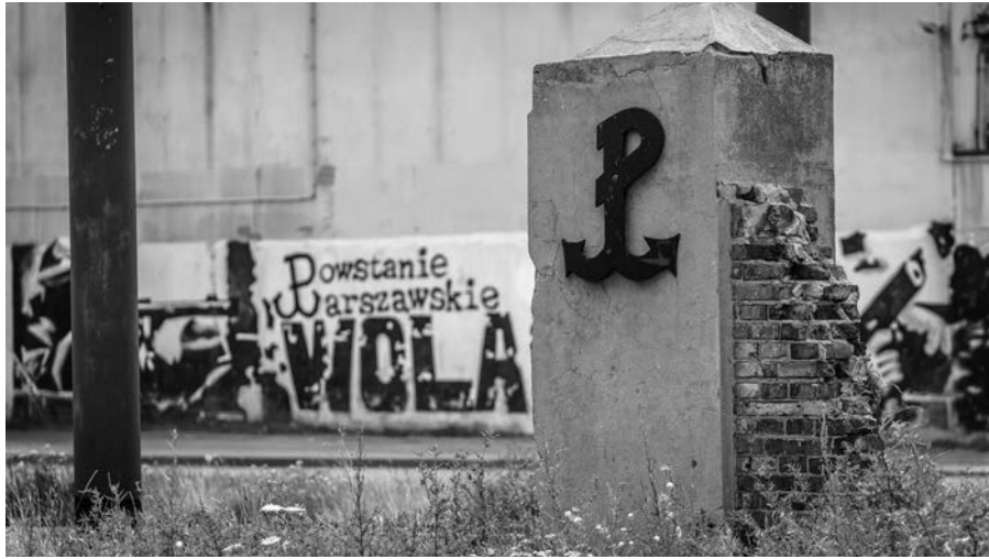
Auch Graffiti erinnern heute in Warschau an den Aufstand.

Im Folgejahr, vom 1. August bis zum 2. Oktober, organisierte der polnische Untergrundstaat in weiten Teilen des übrigen Stadtgebiets einen weiteren wochenlangen Aufstand. Während und nach dessen Niederschlagung zerstörten die Deutschen und ihre Helfershelfer Haus für Haus die Altstadt und weite Teile des Stadtzentrums.