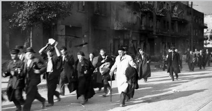
Zivilist*innen werden von SS-Einheiten abgeführt. Deutsche Truppen begehen schwerste Kriegsverbrechen. Die Bevölkerung wird zu großen Teilen aus der Stadt vertrieben und zur Zwangsarbeit verpflichtet.