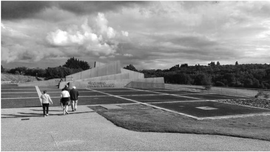
1999 wurde eine neue Gedenk- und Bildungsstätte eröffnet. Nur über sie gelangen Besucher*innen in das »alte Oradour«.