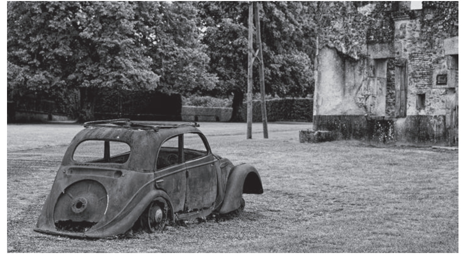
Das Ruinendorf heute

In beiden Punkten enttäuschte die Bundesrepublik die Überlebenden und Hinterbliebenen. In puncto strafrechtlicher Verfolgung richteten sich die Erwartungen