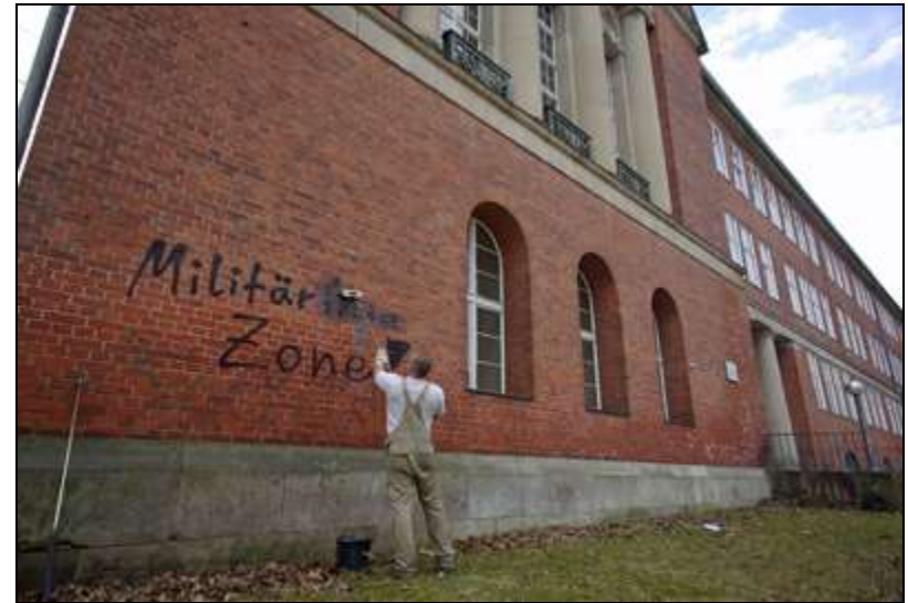
Protest gegen einen Bundeswehr-Schulbesuch an einem Gymnasium in Berlin-Zehlendorf im März 2010