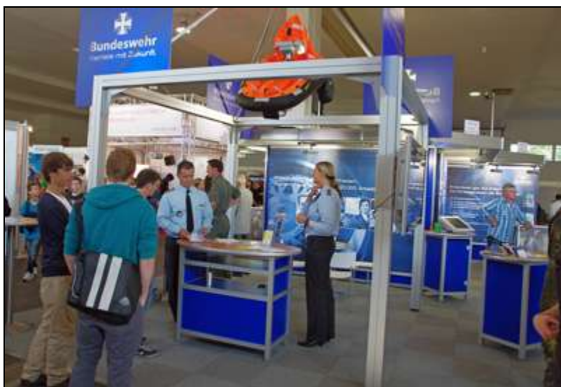
Bundeswehr-Stand auf Jobmesse im September 2011 in Kassel