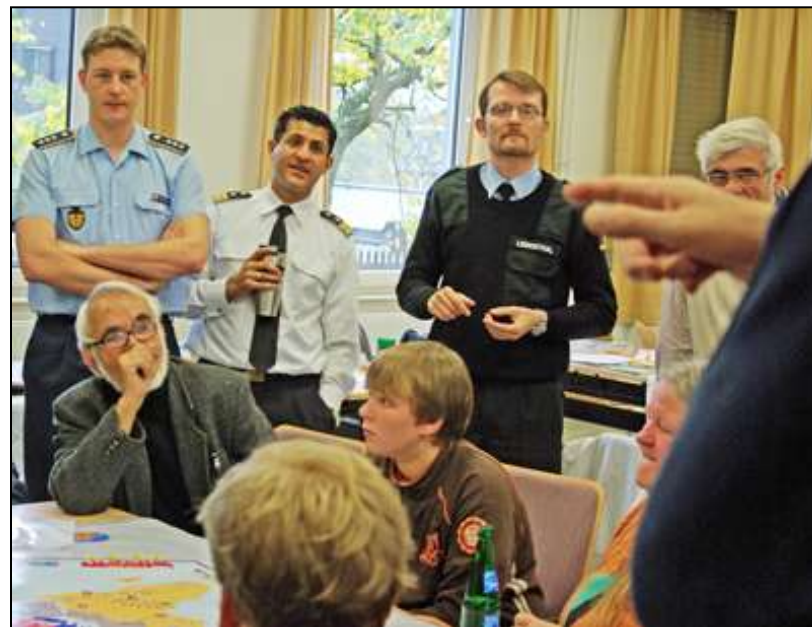
Jugendoffiziere bei einer POL&IS-Simulation im Oktober 2010