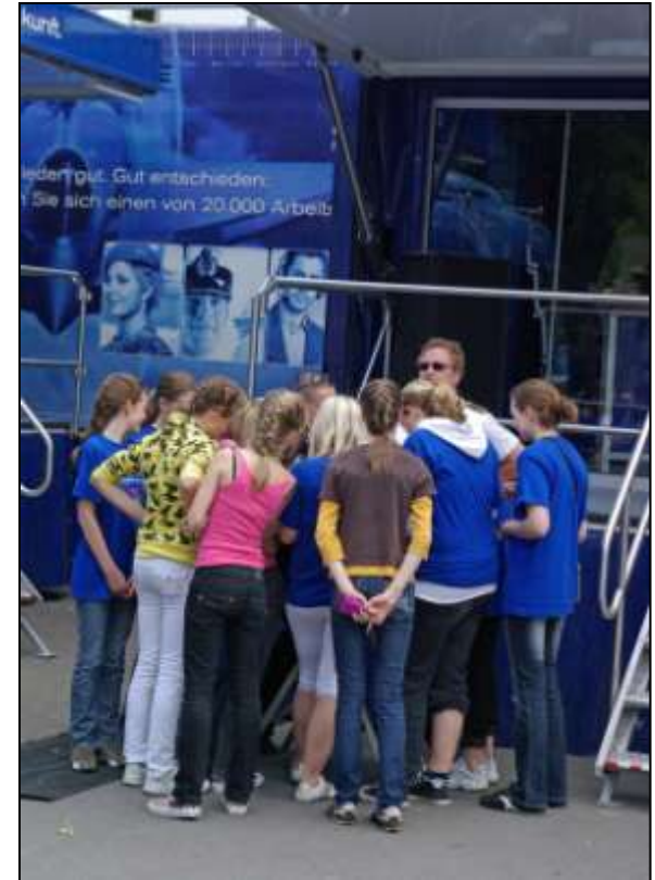
Reinhard-Mohn Berufskolleg in Gütersloh im Mai 2008