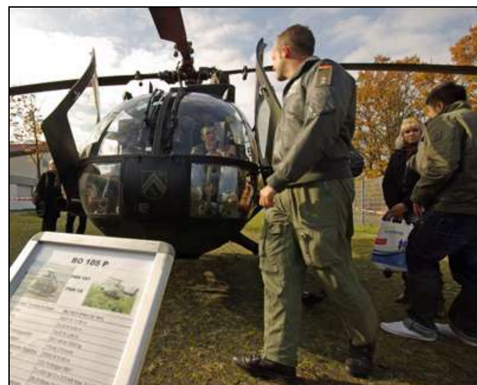
Bundeswehr-Messestand im Oktober 2009 in Kassel