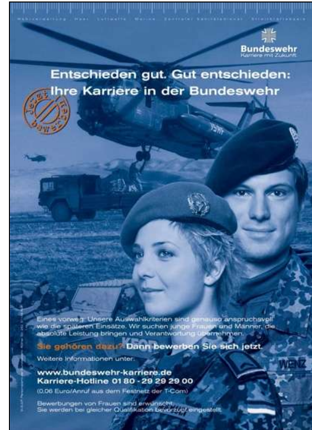
SPIESSER Nr. 116, Seite 27