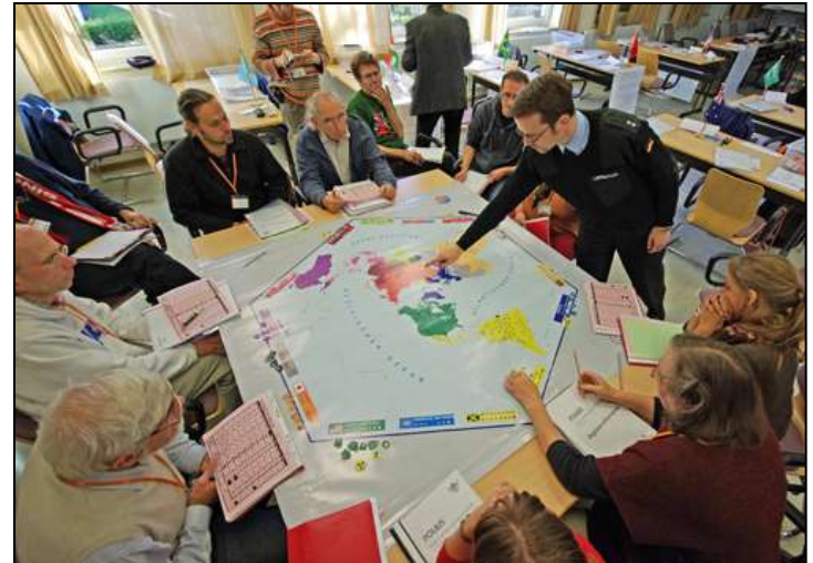
POL&IS-Spiel in Winterberg im Oktober 2010