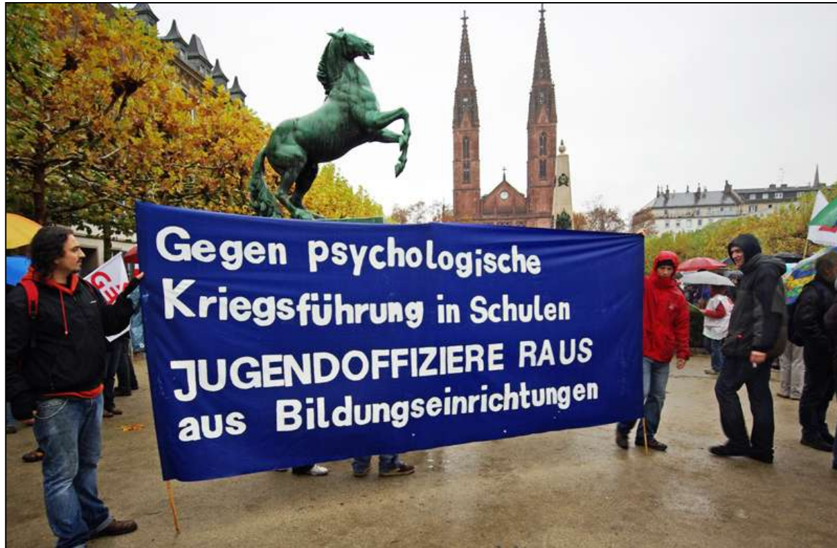
Bildungsdemonstration in Wiesbaden, 17. November 2009